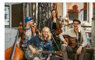
Bluesband See See Riders aus Wiesbaden