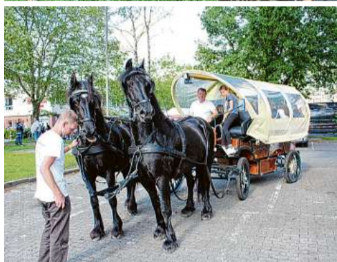
Fahrten mit der Pferdekutsche werden von Kindern und Erwachsenen gleichermaßen genossen